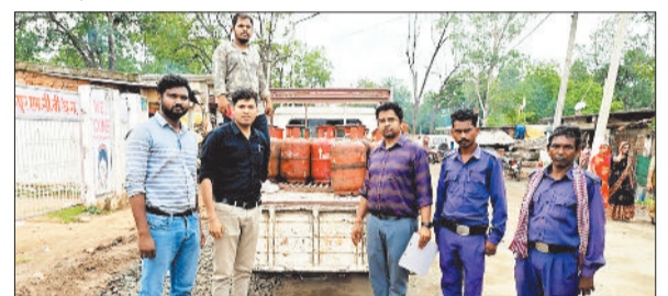
निरीक्षक भरतपुर, खाद्य निरीक्षक कोटाडोल एवं स्थानीय कोटवार के संयुक्त दल द्वारा की गई। अधिकारियों ने स्पष्ट किया कि इस प्रकार का व्यावसायिक उपयोग नियमों का स्पष्ट उल्लंघन है और आने की कार्रवाई दबीकृत पेट्रोलियम गैस (आपूर्ति और

बैकुंठपुर। एमसीबी जिले की जनकपुर नगर पंचायत में खाद्य एवं राजस्व विभाग की संयुक्त टीम द्वारा होटल एवं रेस्टोरेंट में घरेलू गैस सिलेंडरों के दुरुपयोग को रोकने के लिए विशेष जांच अभियान चलाया गया। इस दौरान घरेलू उपयोग के लिए आरक्षित 14.2 किलोग्राम के 24 नग एवं 3 किलोग्राम का 1 नग गैस सिलेण्डर जो आंशिक रूप से भरे अथवा खाली अवस्था में पाए गए, जिसे जब्त किया गया। यह कार्रवाई नायब तहसीलदार कुंवरपुर, खाद्य