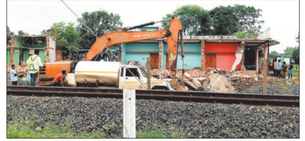
कार्रवाई करती रेलवे की टीम।