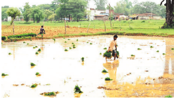
खेती-किसानी करते कृषक।

श्रितिकी समीक्षा की। सीधे किसानों से चर्चा कर वस्तुस्थिति से अवगत हुई। चर्चा के दौरान उन्होंने समिति प्रबंधक को खाद वितरण की नियमित एंटी करने और किसानों को समय पर खाद उपलब्ध कराने के निर्देश दिए। कलेक्टर ने किसानों को बताया कि समिति में अब नैनो डीएपी भी उपलब्ध है, जिसका वितरण शुरू कर दिया गया है।