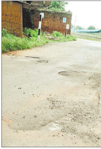
अंडरब्रिज पर गड़ढ़े।

स्थान पर एक स्कोर्पियों वाहन दुर्घटनाग्रस्त हो गया, गाड़ी के चालक को मामूली चोट आई। स्थानीय लोगों के अनुसार अत्यधिक वर्षा के चलते गड़ढ़े में पानी भर गया है, जिससे इसकी गहराई और चौड़ाई लगातार बढ़ रही है। यह गड़ढ़ा रात के समय या तेज रफ्तार में वाहन चलाने पर गंभीर दुर्घटना का कारण बन सकता है। ब्रिज के अंदरूनी हिस्सों में भी कई छोटे-छोटे गड़ढ़े बन चुके हैं, जो धीरे-धीरे बढ़ते जा रहे हैं। यदि समय रहते विभाग ने मरम्मत कार्य नहीं कराया, तो भविष्य में बड़ी दुर्घटनाएं हो सकती हैं। स्थानीय नागरिकों ने संबंधित विभाग से शीघ्र संज्ञान लेकर मरम्मत कार्य कराने की मांग की है, ताकि दुर्घटना घटने से पहले हालात सुधारे जा सकें।