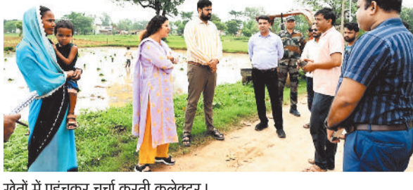
खेतों में पहुंचकर चर्चा करती कलेक्टर।